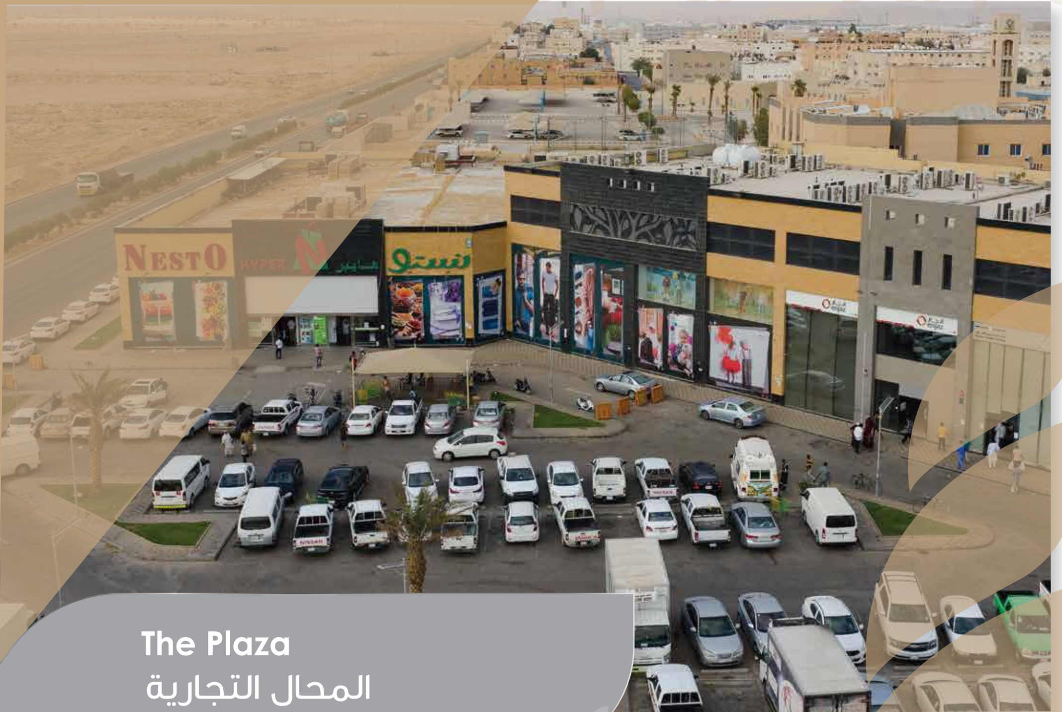
The Plaza المحال التجارية